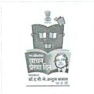
लोगो पोस्टर.jpg 477K