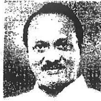
मा. श्री. अजित पवार उप मुख्यमंत्री, महाराष्ट्र राज्य