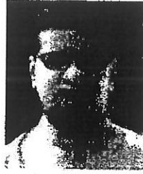
मा. श्री. बाळासाहेब थोरात महसूल मंत्री, महाराष्ट्र राज्य