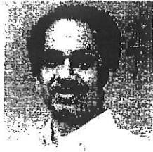
मा. श्री. ज.ड.व. वाळगासाहेब ठाकरे मुख्यमंत्री, महाराष्ट्र राज्य